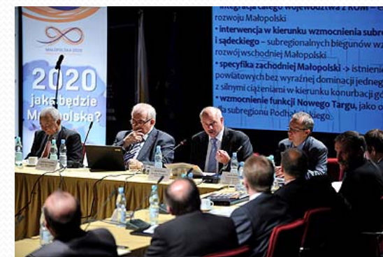
Konferencja dotycząca roli miast, 09.2010