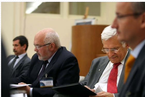
II Konferencja Krakowska, 06.2009