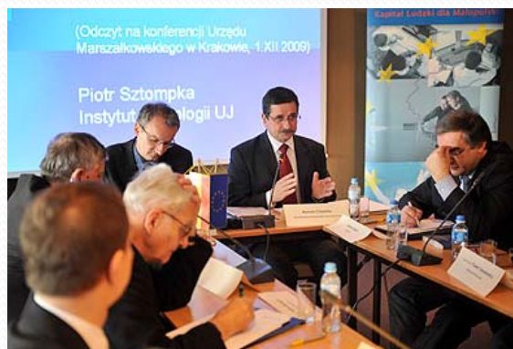
Seminarium poświęcone finansom publicznym, 02.2010