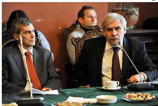
Seminarium poświęcone roli kapitału społecznego, 12.2009